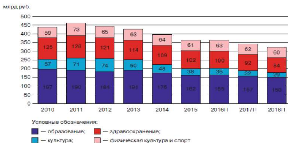
Рисунок 2. Совокупные расходы на инфраструктурные объекты социальной сферы [9]