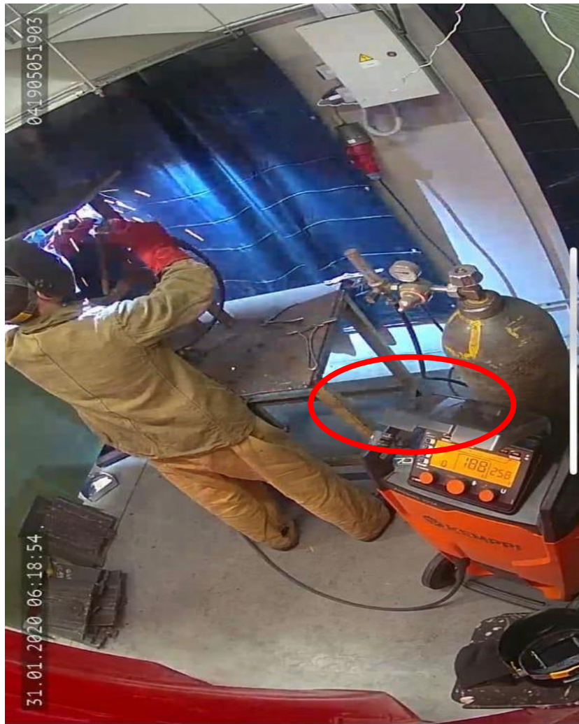
Рисунок 3. Кадр из видеоматериала с поста с предлагаемой системой видеофиксации

Для оценки квалификации сварщика мы предлагаем использовать метод оценки по технологии 3DLD, основанный на принципе сравнения сварного шва с расчетным эталоном без дефектов [3–9].