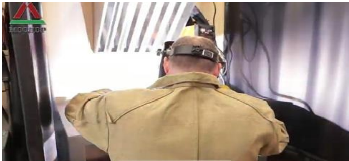
Рисунок 2. Кадр и видеоматериала с камеры, установленной на посту [2]

На рисунке 3 камера настроена так, что можно определить, в каком положении и какие детали варит сварщик, а также характеристики изменения режима сварки, фиксируемые на панели приборов сварочного аппарата (выделены красным овалом), которые дают понимание о том, как экзаменуемый ведет процесс сварки, стабильность и плавность манипуляций, скорость сварки, т.е. возможно дистанционно оценивать моторные действия сварщика, определяющие его квалификацию.