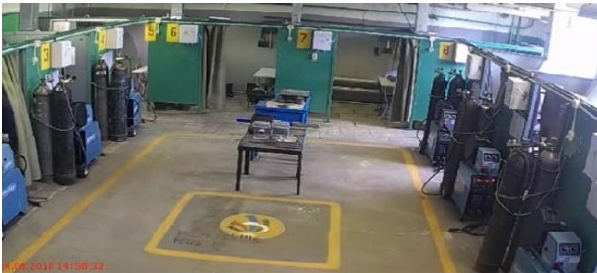
Рисунок 1. Кадр из видеоматериала с практического испытания сварщика

проходит практическую аттестацию сварщик, и мы видим, что данная камера не показывает те требования, которые необходимы для оценки квалификации сварщика при проведении экзамена.