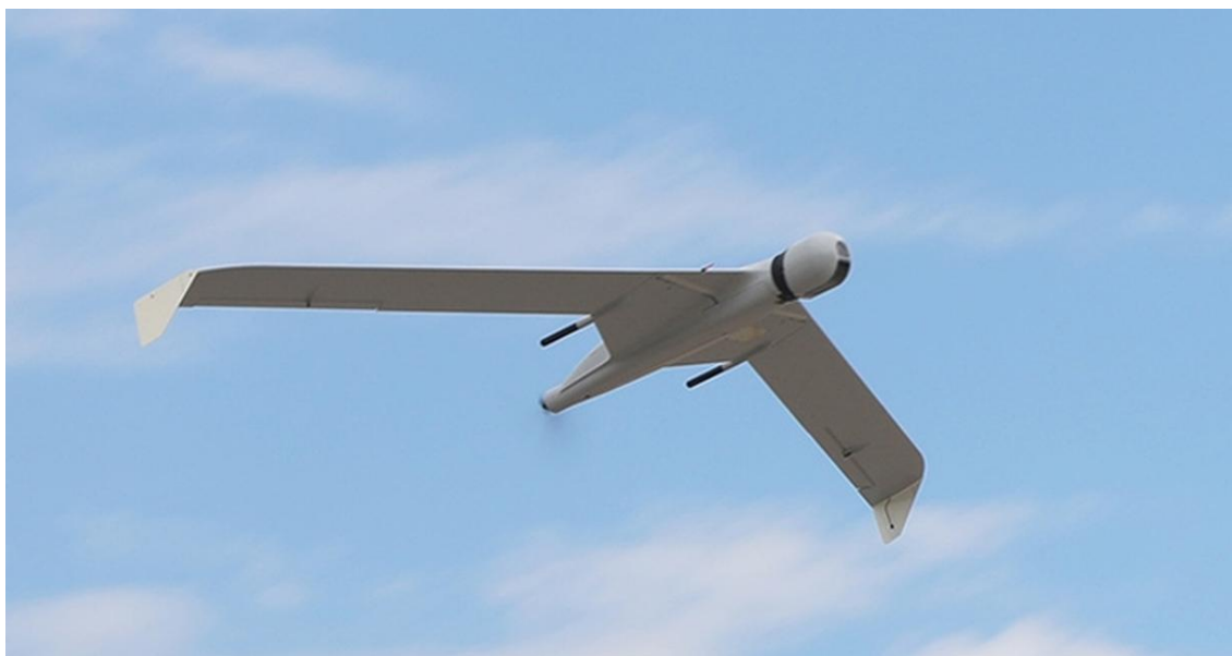
Рисунок 1. БПЛА самолетного типа