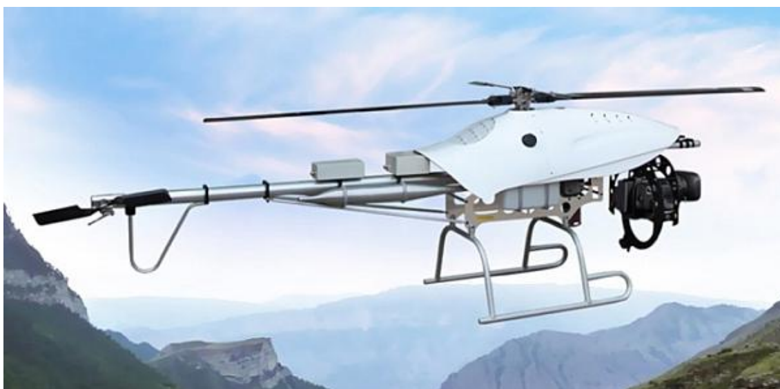
Рисунок 2. БПЛА вертолетного типа

Данные с беспилотного летательного аппарата можно получать в режиме реального времени на базовую станцию управления. Фотографии (рисунок 3), полученные с помощью фотокамеры, в специализированном фотограмметрическом программном обеспечении «PhotoScan» сшиваются в единый ортофотоплан (рисунок 4).