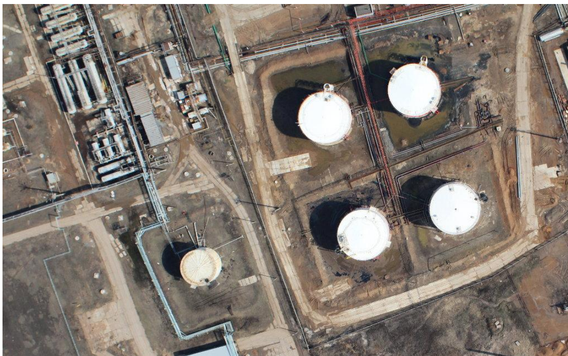
Рисунок 3. Пример аэрофотосъемки с БПЛА