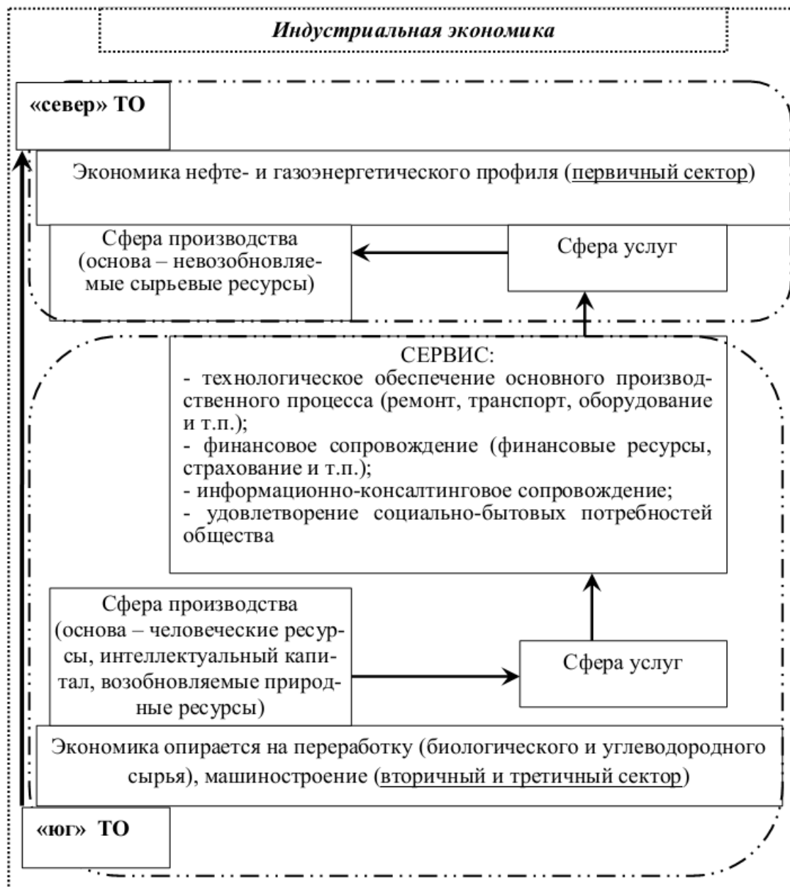
Рис. 1. Существующая территориально-производственная структура регионального хозяйства

Экономика «севера» представлена в основном нефтегазодобывающим производством, здесь хорошо развиты и эффективно функционируют предприятия – представители первичного сектора. Сервис же носит второстепенный характер и развивается как неотъемлемая часть, как сопровождение основных технологических процессов в указанном производстве. При этом крупным «поставщиком» сервиса являются предприятия «юга».