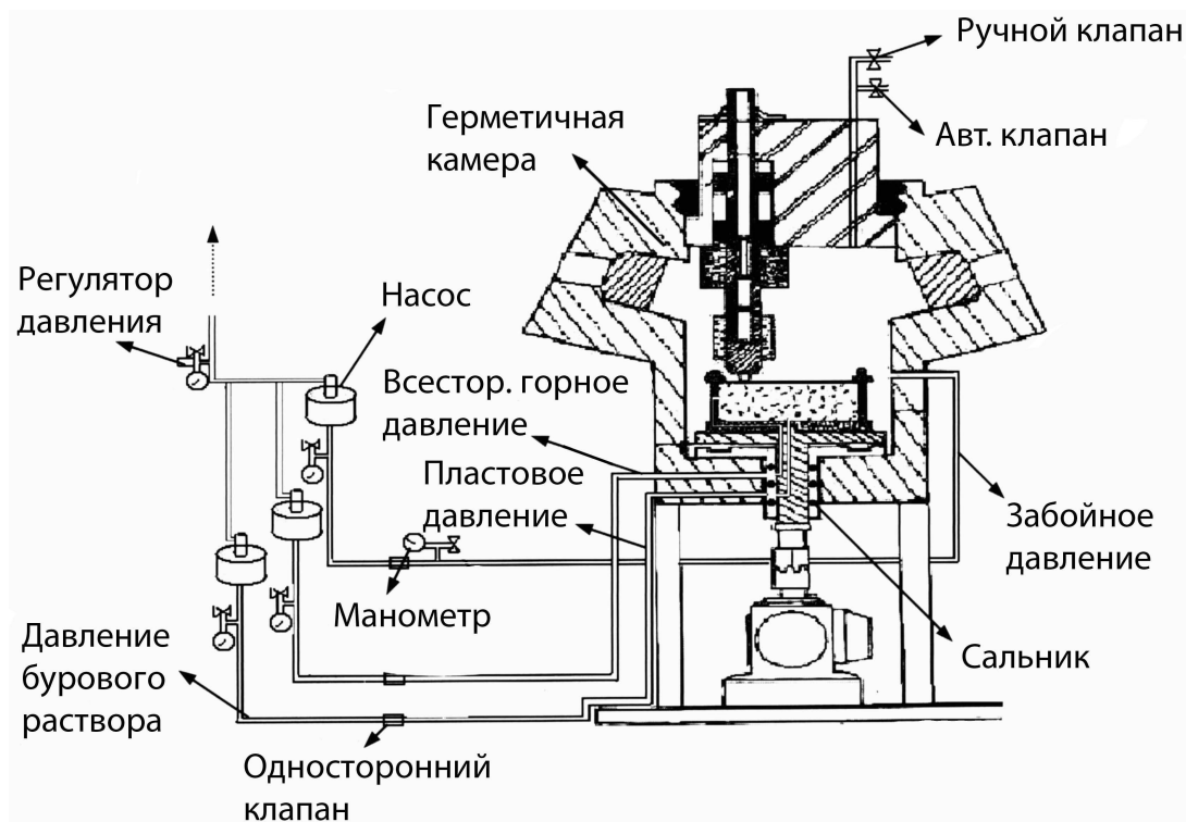
Рис. 3. Принципиальная схема измерительной установки

образец горной породы. Затем резец PDC подавался вертикально вниз и внедрялся в горную породу. Данный стенд предназначен для проведения почти одного оборота с фиксированной глубиной проникновения. Используя пневматический поршень для нагружения, система подачи способна создавать вертикальное усилие до 12,5 кН и внедрять резец на установленную глубину в течение десятых долей секунды. Приложенные к резцу силы измерялись набором тензодатчиков, расположенных выше резца на приводном вале. При этом измерялись радиальная, тангенциальная и осевая составляющая сил. Оборудование способно создавать три отдельных давления на горную породу (рис. 3): всестороннее сжимающее давление, действующее на боковые стенки цилиндрического образца породы; давление в поровом пространстве горной породы; забойное давление. При всем обилии задаваемых входных параметров, данная работа не лишена недостатков, связанных с использованием схемы обращенного забоя и отсутствием исследований эффекта взаимодействия соседних резцов, перекрывающих друг друга.