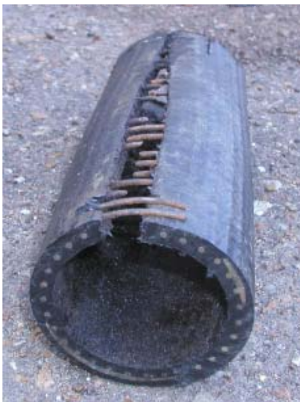
Рисунок 2. Образец разрушенной МПТ

На рис.2 представлен разрушенный образец МПТ диаметром 89 мм производства ООО «МЕПОС», эксплуатируемой на выкидной линии нефтяной скважины в НГДУ «Чекмагушнефть» в течение 9,5 лет. Анализ МПТ показал, что разрушение произошло при запуске насоса на выходе из трубопровода при закрытой задвижки и поднятии давления до 6,0 МПа, т.е. гидроудара. При этом диаметр проволоки из-за коррозионного разрушения местами уменьшился с 2,5 мм до 2.0 мм.