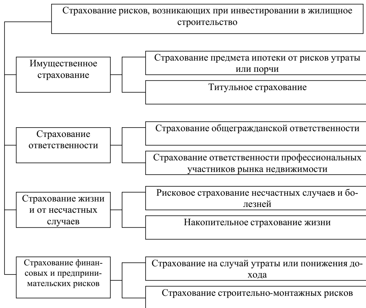
Рисунок 2 – Виды страхования в инвестиционно-финансовом обеспечении жилищного строительства

Виды страхования в системе инвестиционно-финансового обеспечения жилищного строительства схематически представлены на рисунке 2.