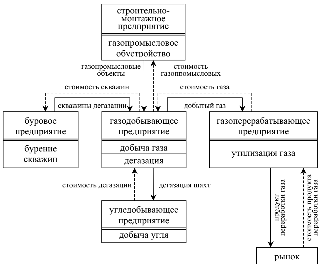
Рисунок 1. Схема организационно-экономического механизма реализации проекта дегазации угольных шахт и состава его участников (вариант 1)

(вариант 2). На рисунке 2 показана схема организационно-экономического механизма реализации проекта дегазации угольных шахт и состава его участников по варианту 2. В табл. 2 приведены затраты и результаты предприятий-участников проекта дегазации по варианту 2.