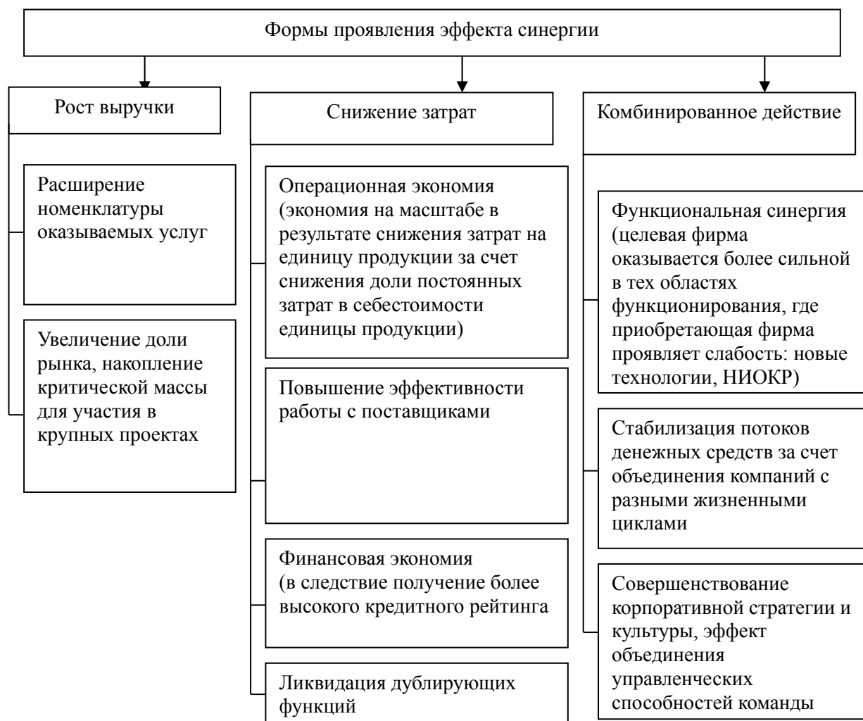
Рис. 2. Формы проявления эффекта синергии

Качественный анализ предполагает создание «списка заявок» на эффекты синергии и отбор из него наиболее вероятных (реалистичных) причин их возникновения (применительно к конкретной сделке) на основе выявления потенциала комбинирования ресурсов.